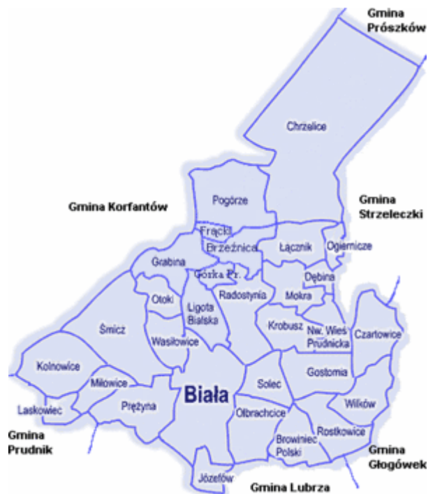
Rysunek 1. Położenie Gminy Biała w Powiecie Prudnickim.

Gminę tworzą sołectwa: Browiniec Polski, Brzeźnica, Chrzelice, Czarłowie, Dębina, Gostomia, Górka Prudnicka, Grabina, Józefów, Kolnowice, Krobosz, Laskowiec, Ligota Bialska, Łącznik, Miłowice, Mokra, Nowa Wieś Prudnicka, Ogiernicze, Olbrachcice, Otoki, Pogórze, Prężyna, Radostynia, Rostkowice, Solec, Śmicz, Wasiłowice oraz Wilków.