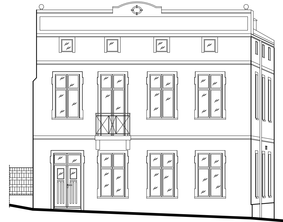
ELEWACJA WSCHODNIA SKALA 1:100 INWENTARYZACJA